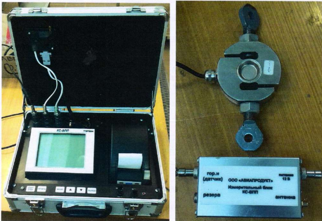
Рисунок 1 – Общий вид блока регистрации измерительного КС-ВПП

Блок регистрации имеет USB-порт для подключения к персональному компьютеру.